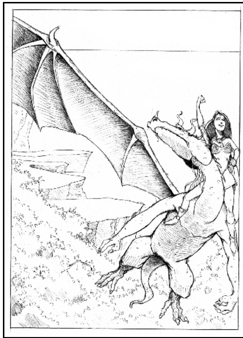
Maïa et son Dragon par Frémor